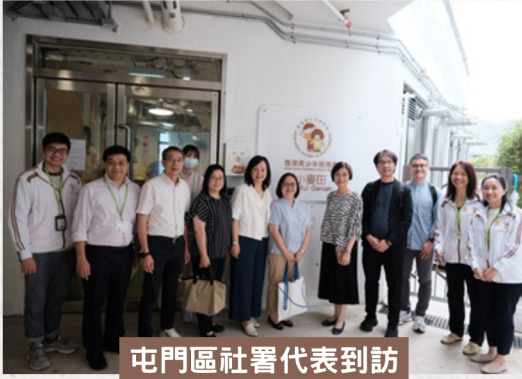
屯門區社署代表到訪