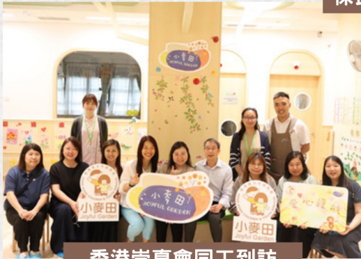
香港崇真會同工到訪