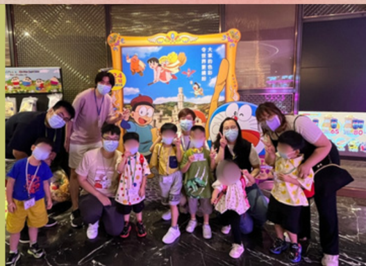
由義工陪伴幼兒到戲院觀賞電影