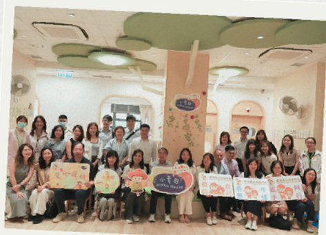
元朗區社署及非政府機構代表到訪