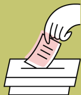
在中心通過模擬投票活動，建立幼兒的公民責任感。