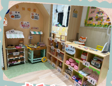
本季主題：超級市場