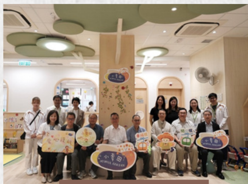
本處執行委員會到訪