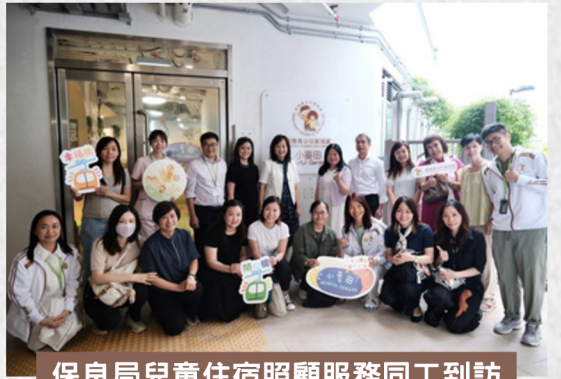
保良局兒童住宿照顧服務同工到訪