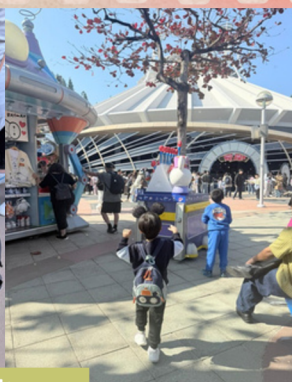
安排中心幼兒及其家人到迪士尼游玩，享受親子時光。