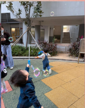
帶領幼兒探索社區，認識超級市場及公園。