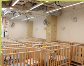
小麥草(0-3歲幼兒睡房)