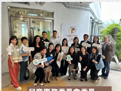
兒童事務委員會委員、 勞工及福利局代表到訪