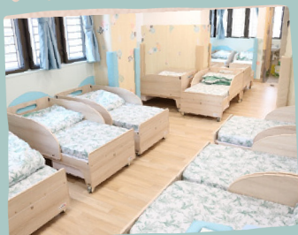
大麥草(3-6歲幼兒睡房)