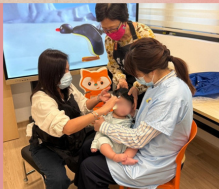
義剪義工為幼兒剪髮

在萬聖節安排職員藏身不同房間中，由老師帶領幼兒逐一敲門玩Trick-or-Treat，讓孩子們感受節日氣氛。