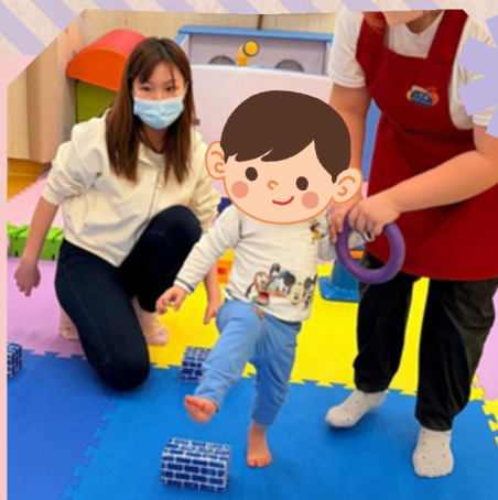
改善幼兒的姿勢控制